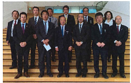
産業労働組合組織内議員

議会改革基本条例に則り、年2回報告会を開会し市民に意見を伺っております。今回は精義地区が担当で市民からは、桑名駅自由通路、総合医療センター、自動運転実証実験の経緯、NTN総合運動公園、デジタル防災行政無線、津波ハザードマップ、液状化マップとさまざまな視点から意見をいただきました。