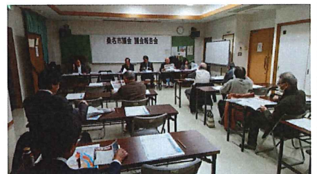
精義地区 桑名市議会 議会報告会