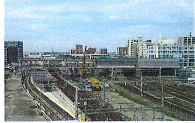
自由通路 全景(南側より)