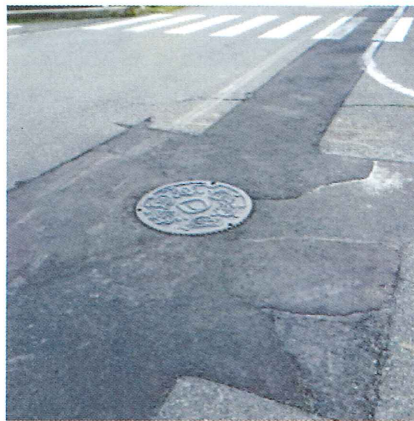
「下水道工事が完了した上之輪嘉例川線」