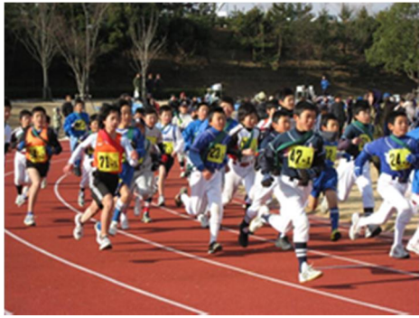
スタート地点で密集している