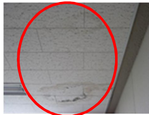
・赤○内は雨漏りの後

・今回補正予算【4,380 千円】で計上されていた事業を見てきました事業を視察してきました。公共施設マネジメント推進事業で長期的なスケジュール等の計画施策で動いてほしいですね。