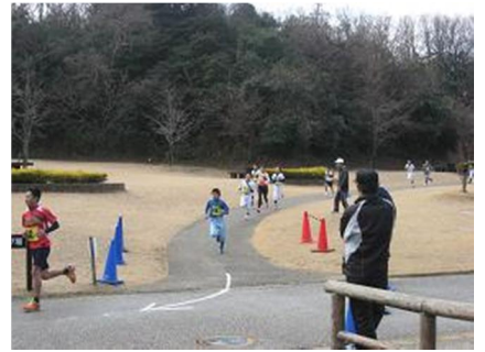
コース変更後安全になった