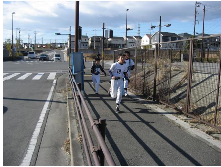
歩道のコースが狭く危険