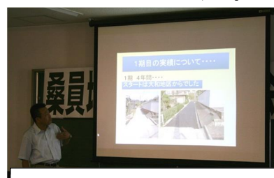
桑名市体育館の会議室にて