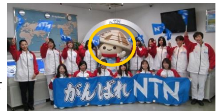
がんばれ！NTN陸上競技部

今回TBSニューイヤー駅伝2014 ホームページで【チーム対抗大応援合戦】という企画があり、桑名市マスコットキャラクター「ゆめはまちゃん」登場させていただきました。桑名市を少しでも全国にPRできるよう頑張ります。