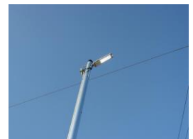
【仮設街路灯を点けます】