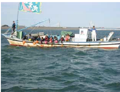
城南小学校・赤須賀漁港はまぐり稚貝放流見学