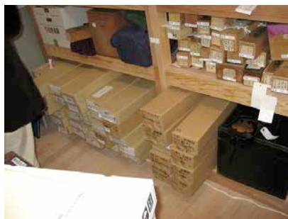
桑名市博物館では貴重な保管庫を見学