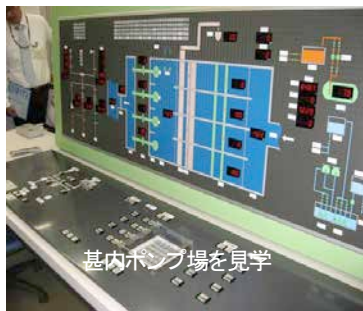
甚内ポンプ場を見学