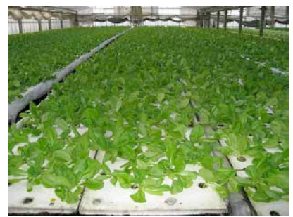
長島町西福豊水耕栽培施設を見学