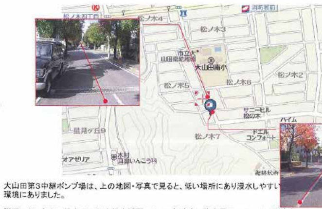
大山田第3中継ポンプ場は、上の地図・写真で見ると、低い場所にあり浸水しやすい環境にありました。

今回の下水道事業会計補正予算があがっていました、大山田第3中継ポンプ場の被害状況を見てきましたので写真で報告します。