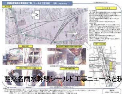
西桑名雨水幹線シールド工事ニュースと現場見学 (1月にはトンネル内を見学します)