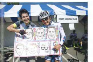
ホームステージのキナンサイクリングチーム