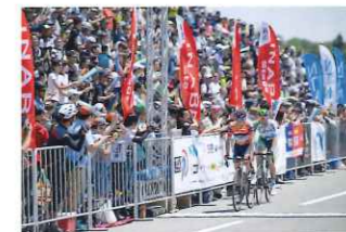
気分がヒートアップするフィニッシュ