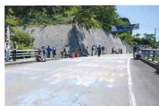
レース当日朝にチョコイベントが開催されます