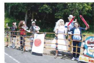
沿道マネキンは毎年増えている?