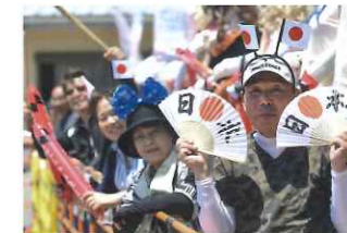
今年もたくさん見られそうな日本の応援