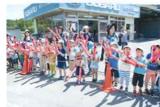
コース上にある唯一のSUBARU販売店はいなべにあります