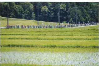
この綺麗なラインを見なければ是非いなべにおいでください