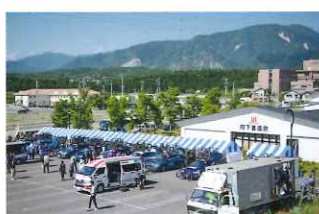
一度は入ってみたい阿下喜温泉前にはチームピットがズラリ