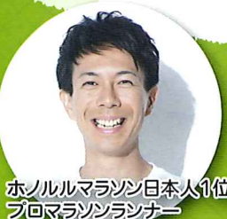
ホノルルマラソン日本人1位 プロマラソンランナー

Special! JAあいち尾東のお米や農産品など 素敵なプレゼントが当たる抽選会も開催!