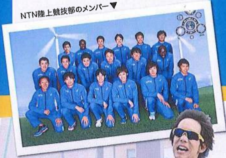
NTN陸上競技部のメンバー▼