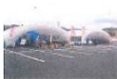
被災者生活支援施設として活用されています。