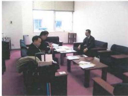
杉田コメリ災害対策センター理事から説明を受ける 会派メンバー達。(右写真⇒)