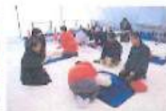
被災者生活支援施設として活用されています。