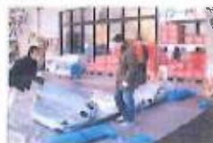
被災者生活支援施設として活用されています。