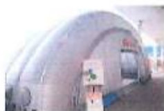
被災者生活支援施設として活用されています。