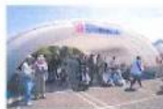
被災者生活支援施設として活用されています。