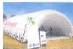
被災者生活支援施設として活用されています。