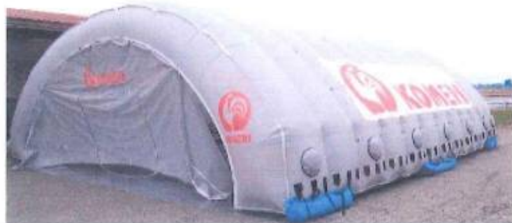
●被災者生活支援施設

新潟県中越地震では余震が数日間続き、多くのみなさまが不安な夜を過ごされました。コメリの駐車場において車中泊をされている方もおられ、エコノミー症候群が大変心配されました。そこでNPO 法人コメリ災害対策センターでは一時避難場所として簡単に設営可能な大型テントの「エアロシェルター」を導入しています。万が一の際に迅速に設営できるよう、平常時には防災訓練や防災啓発活動などで積極的に活用しています。