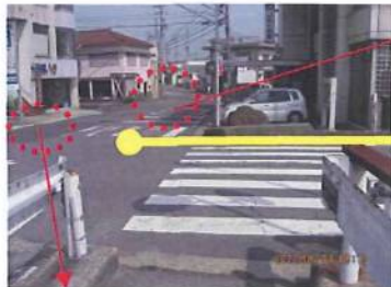
水道か農水か分かりませんが、工事後横断歩道が消えています。

いつもお世話になっております。 議員になる前から弊社交通安全貢献という事で、毎月11日交通安全立哨に参加しています。 しかし、ルールを守らせるという前に「止まれ・横断歩道」が消えてはどどこが停止ラインか どこを渡れば良いのだろうと疑問に思います。 特に、142号が開通してからは横断歩道が無いままの所もありました。 一度現場を見ていただければ幸いかと思いますのでお願いいたします。 直接通学は実施していませんが、特別支援学校・高等部の生徒は学校周辺を体力強化と言う ことでランニングを実施しております。一部は横断歩道がありません。