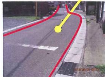
大成小学校に向かう道です。側道の白いラインがありません。