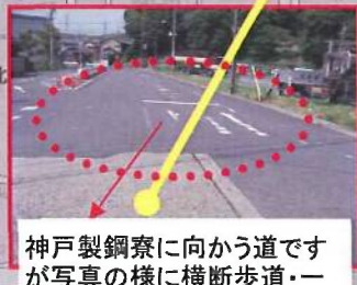
神戸製鋼所に向かう道ですが写真の様に横断歩道・一旦停止が消えています。