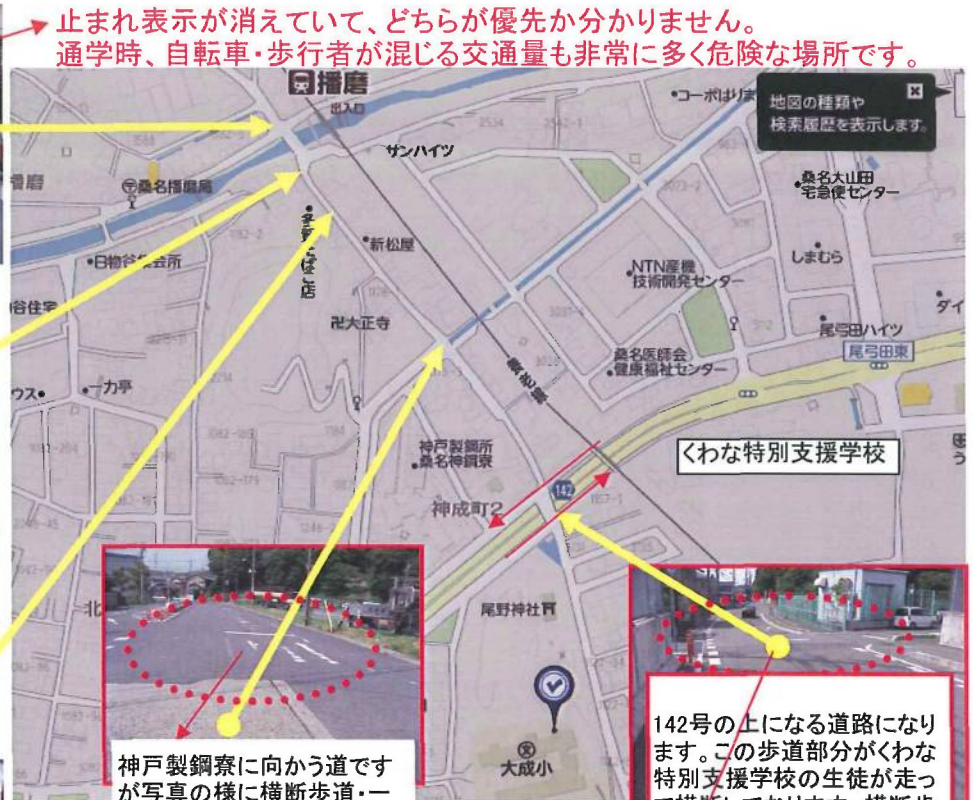
止まれ表示が消えていて、どちらが優先か分かりません。通学時、自転車・歩行者が混じる交通量も非常に多く危険な場所です。