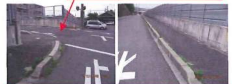
特別支援学校から上がって来る方から歩道橋に向け撮影しました。

大成小学校付近は歩道が一段上になり安全ですが、その周辺の側道が危険なポイントと思います。