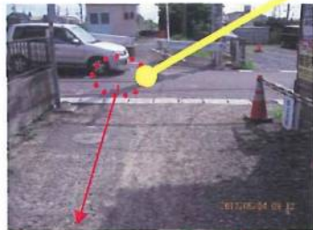
砂利道から歩行者が出てくる通学路です。横断歩道が消えています。非常に危険な場所です。