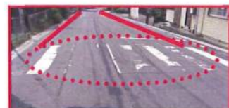
←NTNIはりま寮 神戸製鋼寮→