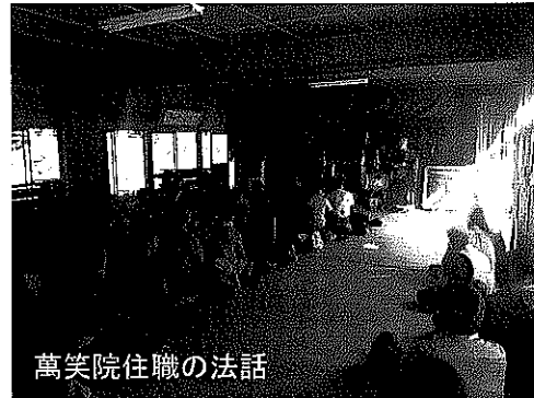
萬笑院住職の法話

→沿線のみならず、津・鈴鹿・他県から43名の参加者がありました。1日フリー乗車券付のため、坐禅後に沿線観光に行かれる方もありました。(43人)