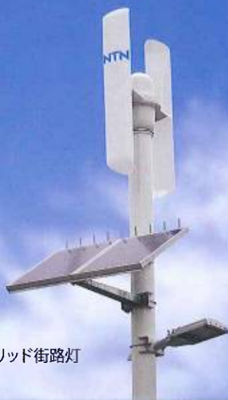
ハイブリッド街路灯