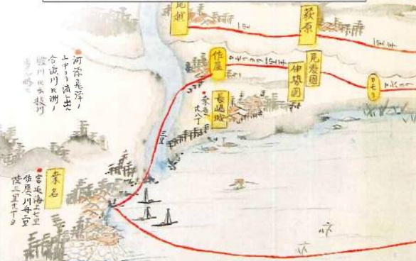
六戦図志「尾州小牧長久手御合戦地図」

灯籠に用いられている図柄のデザインは桑名名物の蛤と、その蛤を育てる木曾三川が流れ込む豊かな遠浅の海の波をモチーフにしています。