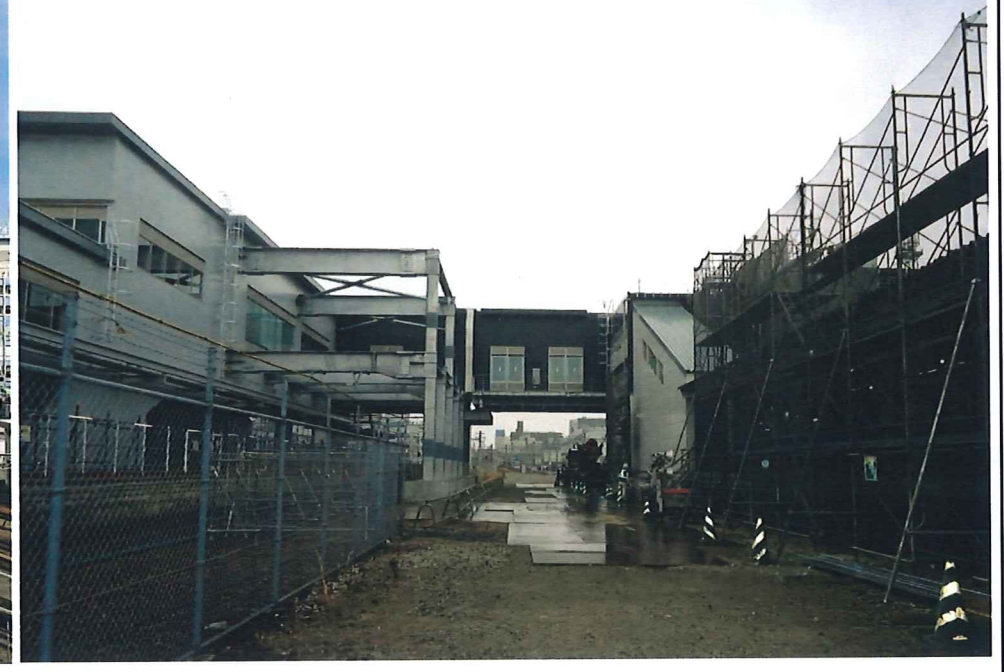
自由通路（北側より）