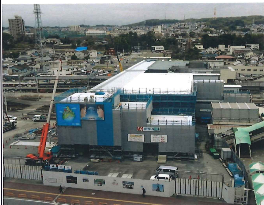
工事現場 全景(東側より)