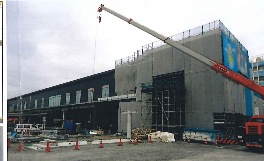
④東側昇降部より自由通路