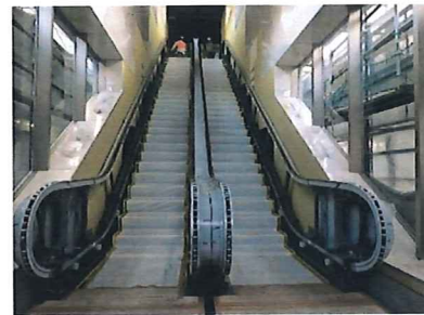
①JR上りホームエスカレーター