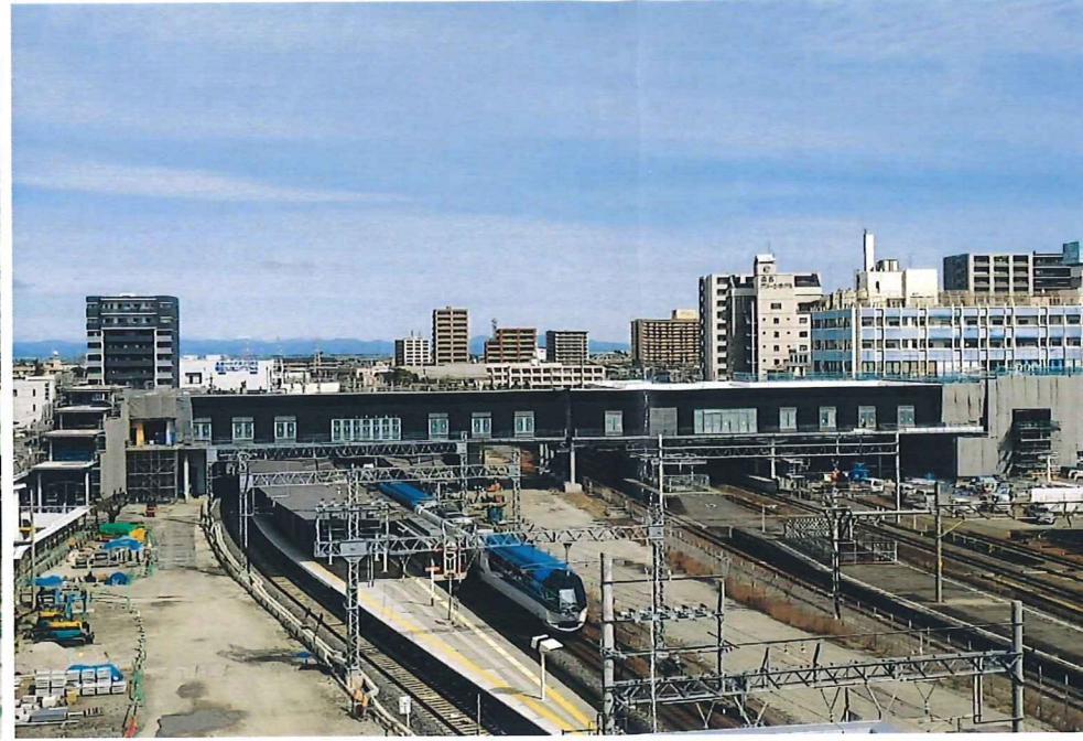
自由通路 全景(南側より)