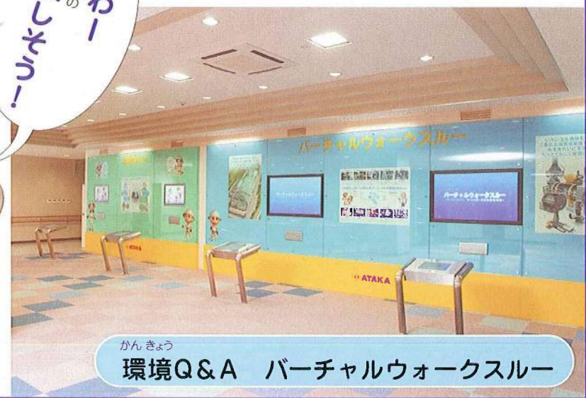
かん きょう 環境Q&A バーチャルウォークスルー