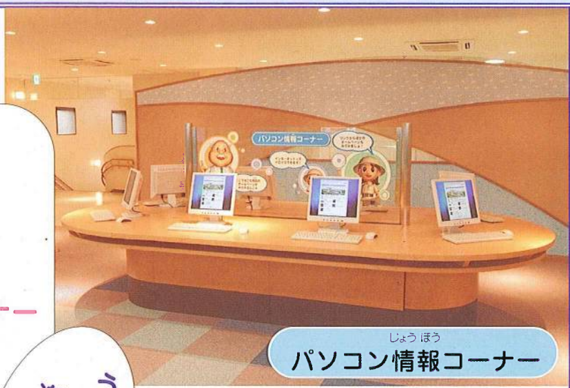
しょう ほう パソコン情報コーナー