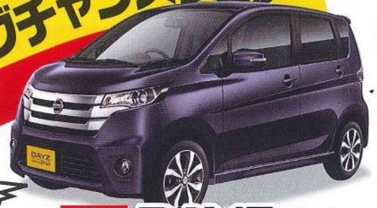
NEW DAYZ デイズ