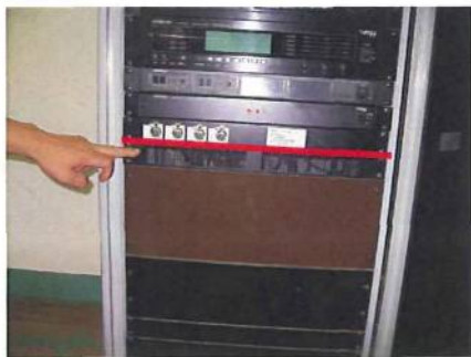
平成20年に発生した水位 結局屋根固定し2段にするようです。

やはり、企業でも「設計がすべてを決める。」とよく言いますが、設計段階で十分専門家と協議する必要があると思いました。