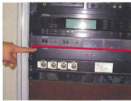
本年7月25日に発生した水位