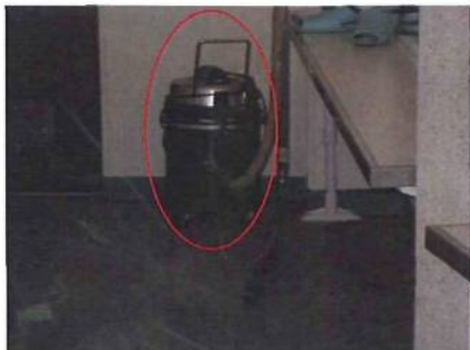
水を吸うバキューム機器も壊れる。