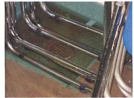
3日目の突然の雨の影響です。