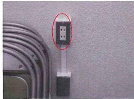
コンセントは無事でした。