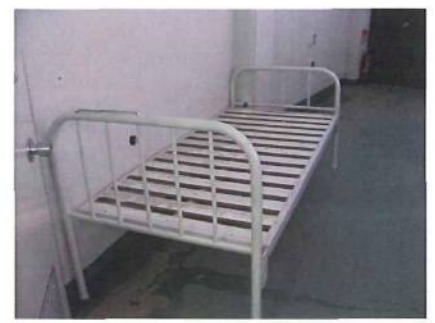
救急用ベッドも水に着く