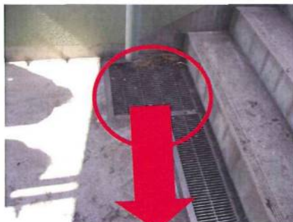
この部分から水が溢れてきました。赤い部分がグラウンドから来る配管です。