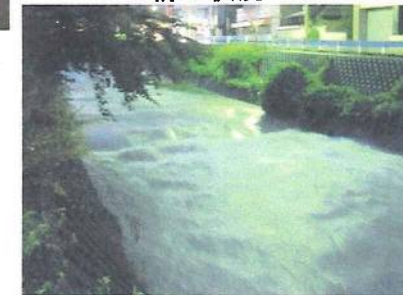
夜、ピークを過ぎた状況