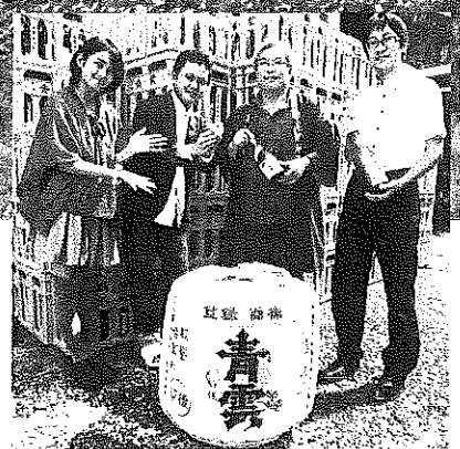
テレビ朝チャンネル「拜啓!! 鉄道人」の企画から生まれた三岐鉄道北勢線とのコラボ商品

嘉例川地区産酒米 北勢線星川駅の北西に位置し、今なお「ヒメタイコウチ」や「ホトケドジョウ」などの希少生物が生存する貴重な里山である嘉例川地区。 次代にこの里山を残すため地区をあげて環境保護に取り組んでいます。昔ながらの水田を残すため減農薬減化学肥料で栽培された酒米を使用することで、少しでも環境保護活動の助けにできればと思います。純米酒を醸しました。