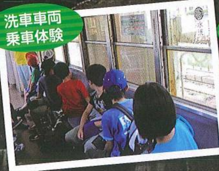
洗車車両 乗車体験