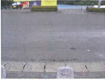
この通りは車も通行可能です