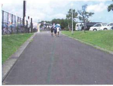
このコースは管理車両のみ