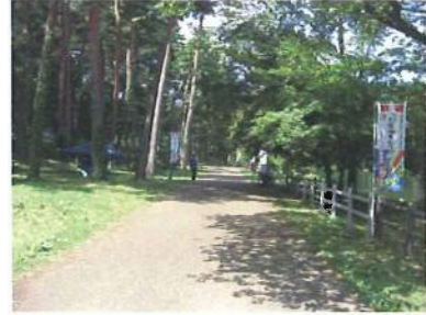
この園路は池の周りです