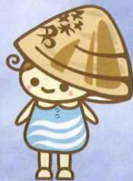
はまぐりのまち・桑名キャラクター 「ゆめはまちゃん」