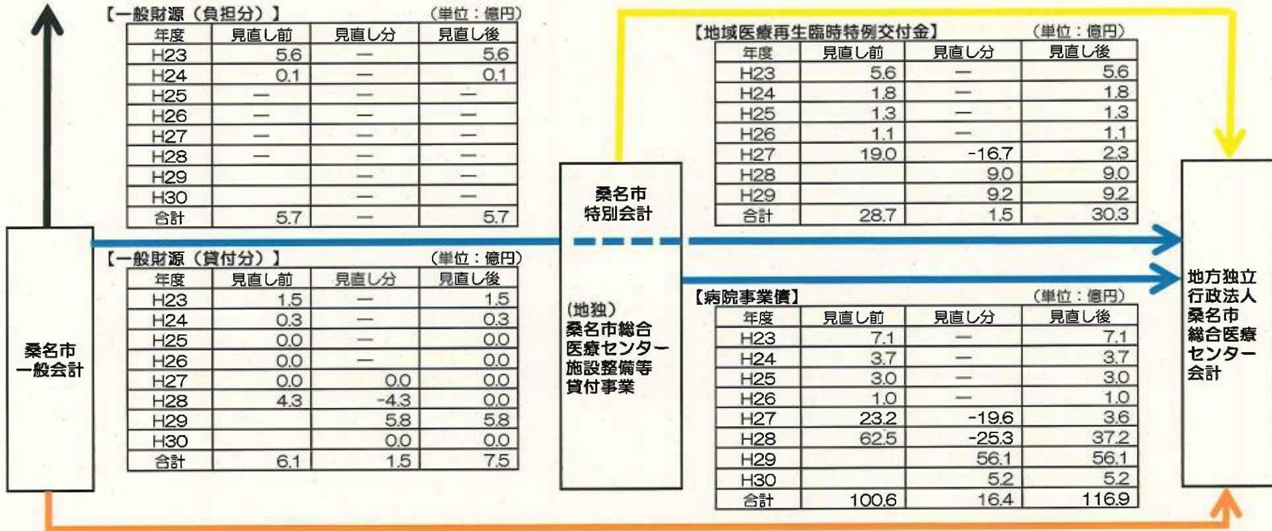
【一般財源（負担分）】 (単位：億円)