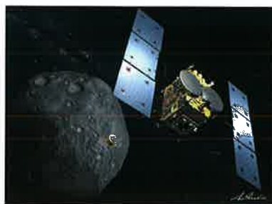
衝突装置を放出する「はやぶさ2」(イメージ)

「はやぶさ2」では、小惑星「1999 JU3」の科学観測やサンプルリターンだけでなく小惑星表面に衝突体を衝突させ人工的にクレータを作ることで、太陽光や太陽風にさらされていない小惑星内部のサンプルを採取するという、新たな挑戦を行います。JAXAはこれら世界初の試みを通じて将来の深宇宙探査をリードする高度な技術の確立を目指します。