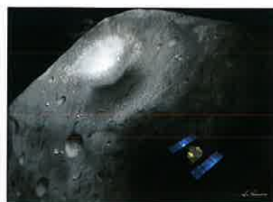
衝突装置により人工的なクレータができた瞬間(イメージ) 「はやぶさ2」は小惑星の背後に回り込み、破片を回避する