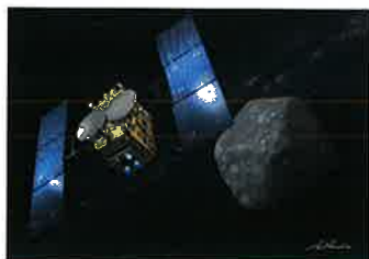
小惑星1999 JU3に接近する「はやぶさ2」(イメージ)

地球の海の水や生命を形づくる有機物は、太陽系が誕生した頃(今からおよそ46億年以上前)から星間ガスの中にすでに存在していたと考えられています。「はやぶさ2」が探査するC型小惑星「1999 JU3」は太陽系が生まれた時代と場所の記憶を比較的良くとどめていると考えられています。小惑星「1999 JU3」の科学観測やサンプルリターンを通じて太陽系や地球、生命の起源と進化の過程を知る手がかりを得ることが期待されています。