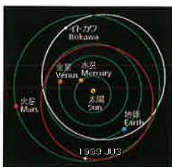
小惑星1999 JU3の軌道(赤線)

「はやぶさ2」では、小惑星「1999 JU3」の科学観測やサンプルリターンだけでなく小惑星表面に衝突体を衝突させ人工的にクレータを作ることで、太陽光や太陽風にさらされていない小惑星内部のサンプルを採取するという、新たな挑戦を行います。JAXAはこれら世界初の試みを通じて将来の深宇宙探査をリードする高度な技術の確立を目指します。