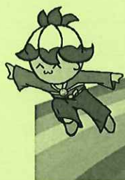
桑名市教育委員会イメージ キャラクター「くわっぼ」