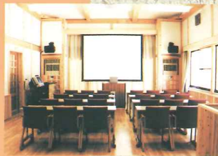
(作業、視聴覚兼展示室)

みんなの願いはいつまでも生きがいを持って楽しく暮らす事。社会参加や生きがいづくりを図るために、カラオケやパソコンなどによって趣味を広げ、異世代交流や仲間づくりを進め健康長寿を応援します。